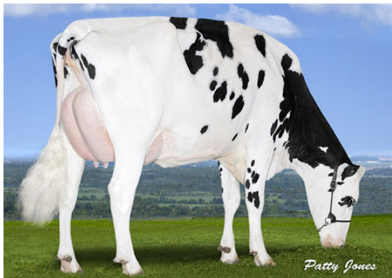
PEAK BOMBERO MAXIMA THIRD DAM