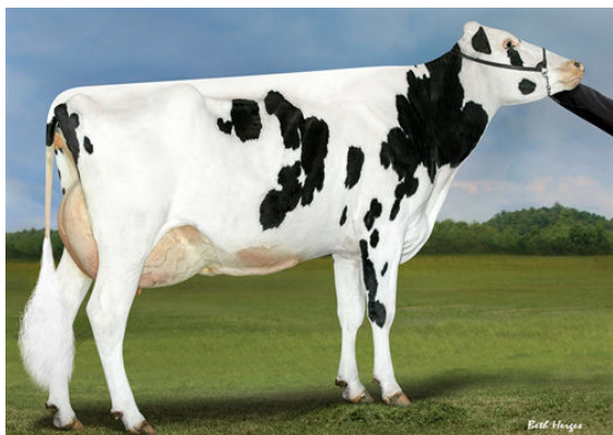
PROGENESIS DUKE MELEE GRANDDAM